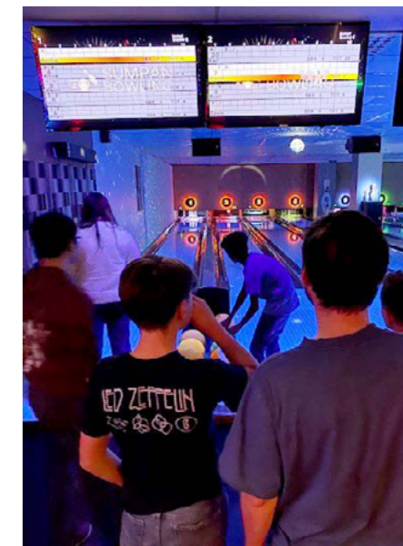
Bowling, Fredax.